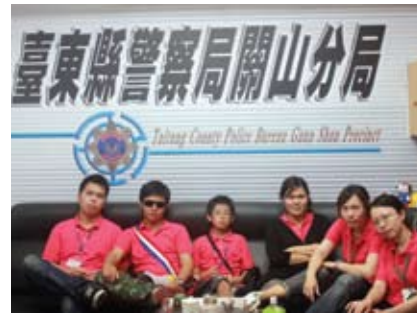
參觀關山分局——刑案記者會