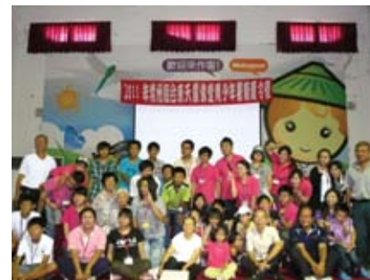
參觀米國學校合影