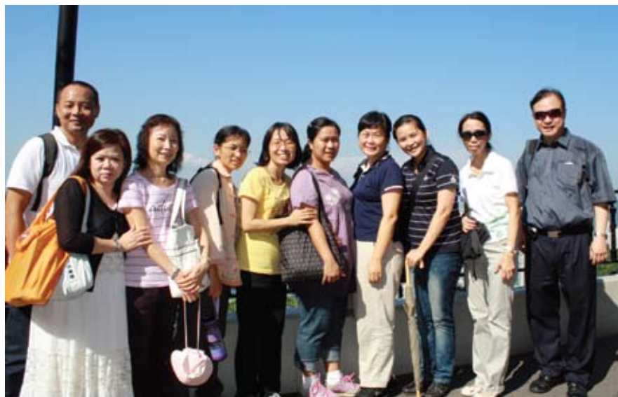
香港太平山一日遊

今年很幸運地在前人慈悲之下，後學可以與道學院教師班的另外五位前賢一起利用暑假跟著前人到海外的道場參訪學習。因為後學平常學習幫辦的台東道場要辦青少年暑期夏令營，澳洲行程無法一同參與，因此後學只就香港以及美國的行程做一個簡單的學習報告。