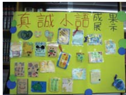
「真誠小語」卡片製作成果展示