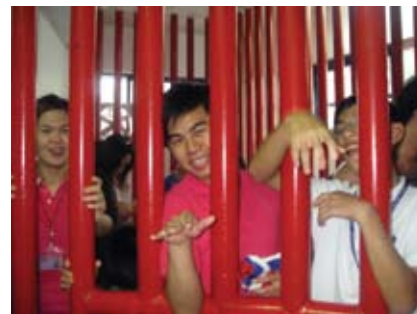
體驗被關的滋味——放我出來啊！

體的建築十分古色古香，據說是日本昭和七年蓋的。此外，裡面還設有警察文物館，介紹早期的警察相關文物，講解的警察大人用風趣談諧的方式介紹這間歷史悠久的警局，大家邊聽邊笑，中間有小小插曲就是體驗被關在監獄，原本想說應該一下就好，沒想到居然真的被鎖在裡面好幾分鐘，真的裡面不好待呀！